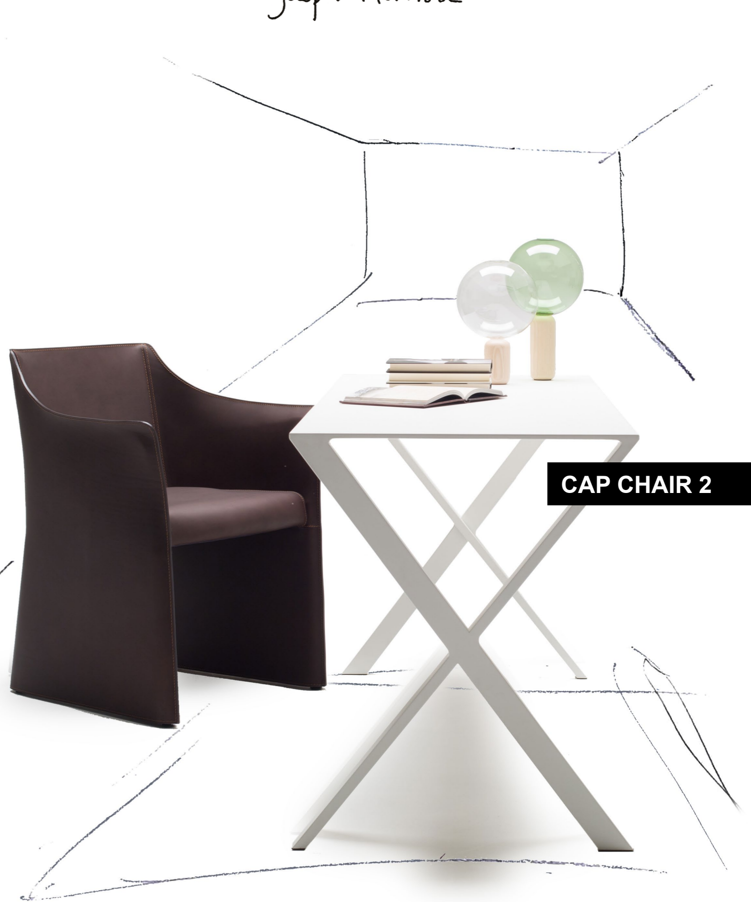
CAP CHAIR 2