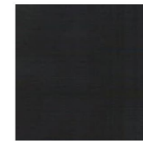
Nero Black Noir